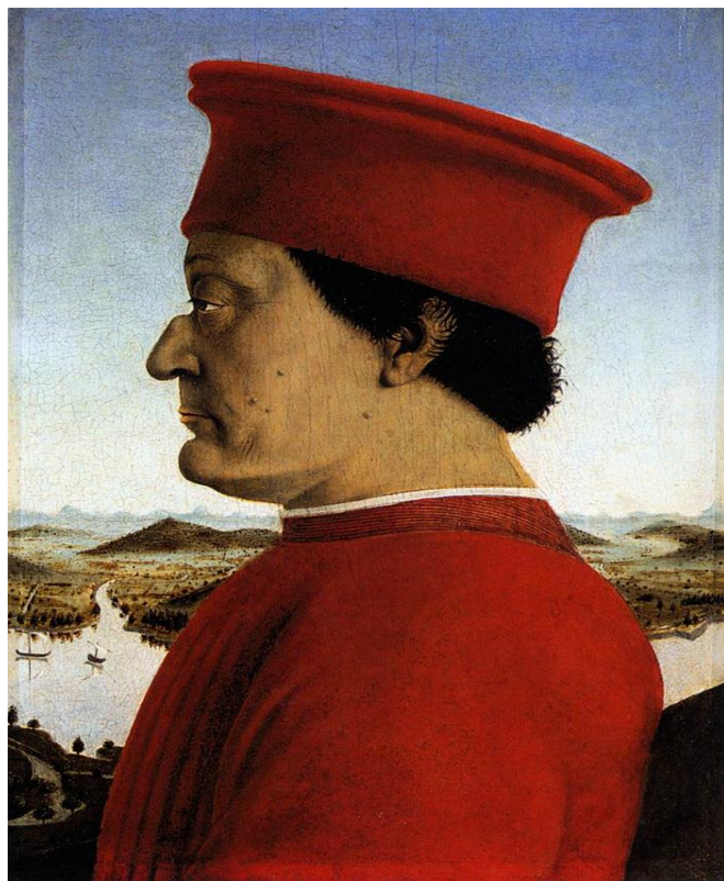
Duque de Urbino, de Piero Della Francesca, 1472.

O retrato de perfil era utilizado desde a Antiguidade, porque era assim que os imperadores romanos eram retratados nas moedas. Na obra do Duque de Urbino, entretanto, a posição foi escolhida pelo artista para ajudar a esconder o lado direito do rosto do duque, marcado por um ferimento em batalha.