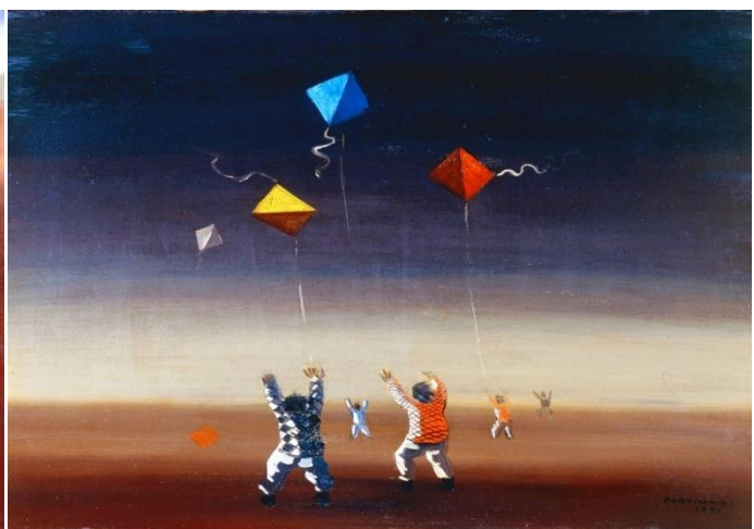
MENINOS SOLTANDO PIPAS, PORTINARI

UMA DAS COISAS QUE AS CRIANÇAS MAIS GOSTAM SÃO OS BRINQUEDOS. DESENHE SEU BRINQUEDO PREFERIDO OU A BRINCADEIRA QUE VOCÊ MAIS GOSTA.