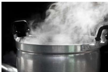
Vasilha de água ao fogo

2- Escreva a condição a que os materiais mostrados nas imagens foram expostos: aquecimento ou resfriamento.