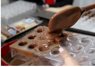
Chocolate sendo moldado

3 -Sabemos que, além dos materiais, os alimentos também sofrem alterações na forma de sua constituição com as variações das temperaturas. Identifique na lista a seguir quais são os alimentos e os materiais que sofreram alterações reversíveis (R) e alterações irreversíveis (I).