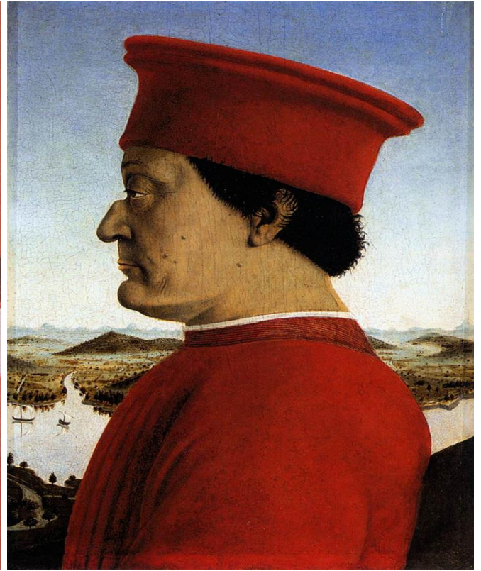
Duque de Urbino, de Piero Della Francesca, 1472.

O retrato de perfil era utilizado desde a Antiguidade, porque era assim que os imperadores romanos eram retratados nas moedas. Na obra do Duque de Urbino, entretanto, a posição foi escolhida pelo artista para ajudar a esconder o lado direito do rosto do duque, marcado por um ferimento em batalha.