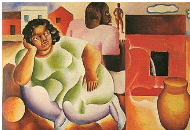
Figura 1 - Devaneio – Di Cavalcanti – 1927