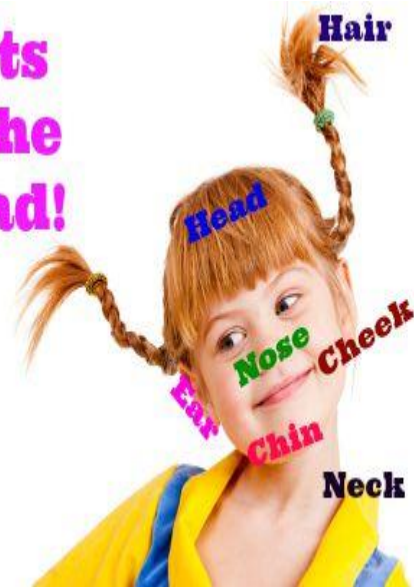
Partes da cabeça em inglês