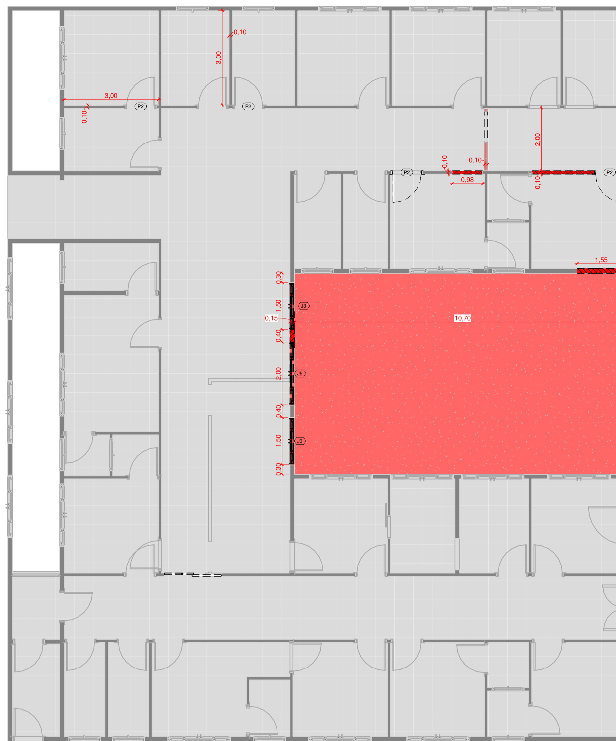
2 Planta de Demolição - Térreo 1 : 75