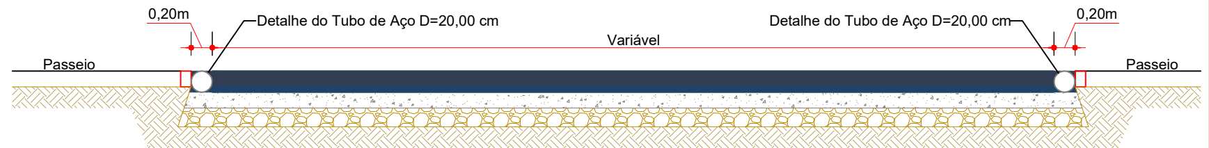
CORTE BB Faixa Elevada Escala: 1/50