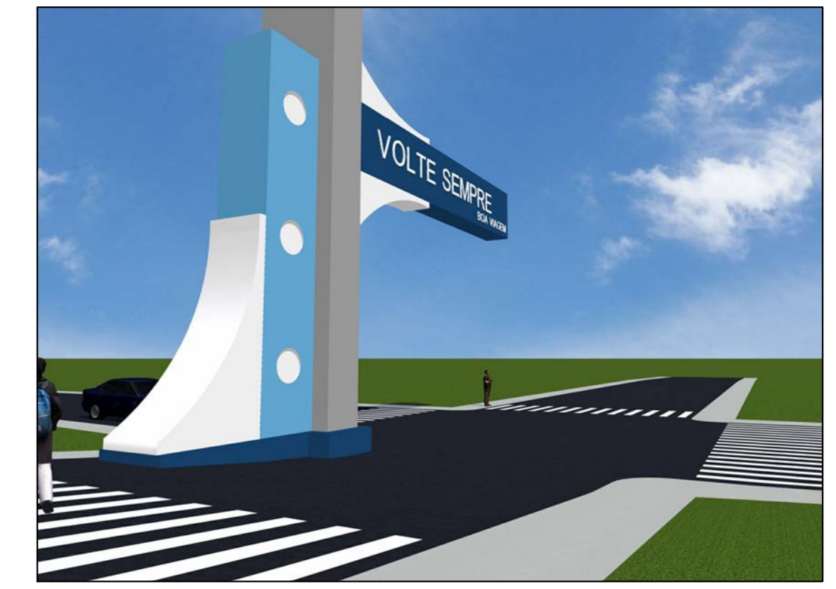
MAQUETE ELETRÔNICA D SEM ESCALA