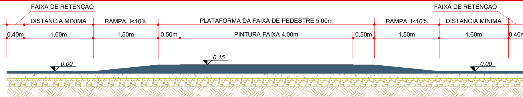
CORTE AA Faixa Elevada Escala: 1/50