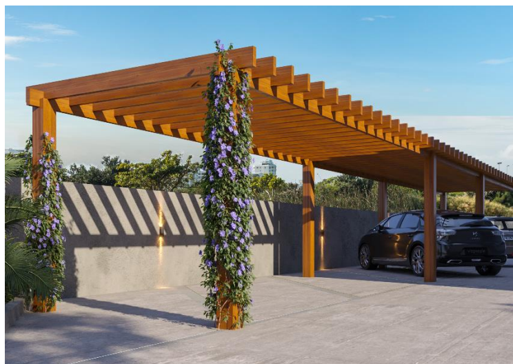
Pergolado para estacionamento de veículos