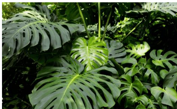
Monstera Deliciosa (Costela de Adão)