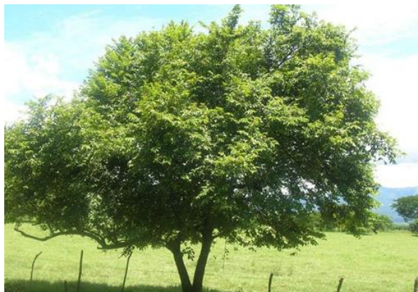
Mutambo - Guazuma ulmifolia (Malvaceae)

No entorno do Paço municipal, serão plantadas 09 unidades da espécie Monstera Deliciosa (Costela de Adão), 09 unidades da espécie Ravela e 06 unidades de Lambaris roxo .