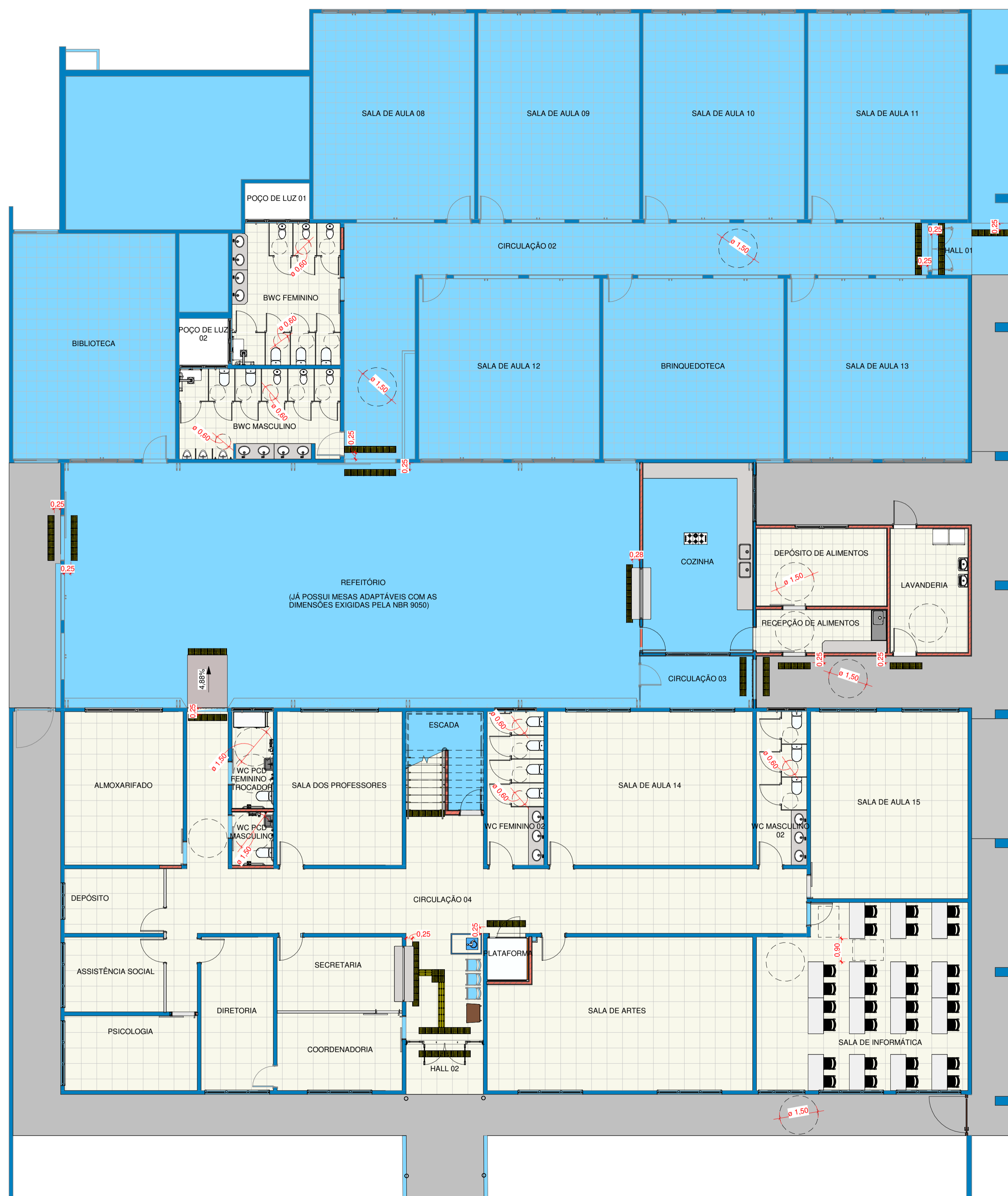
1 Nível 1 - Acessibilidade 1 : 100